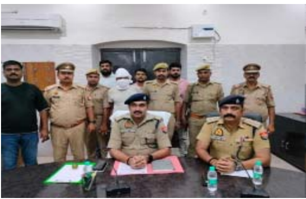
हरदोई(एजेंसी)। जिले में एक 8